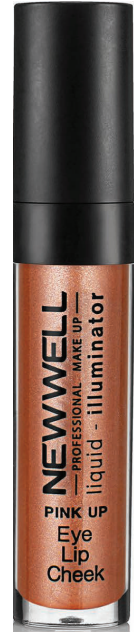
Pink - Up 8680923345987